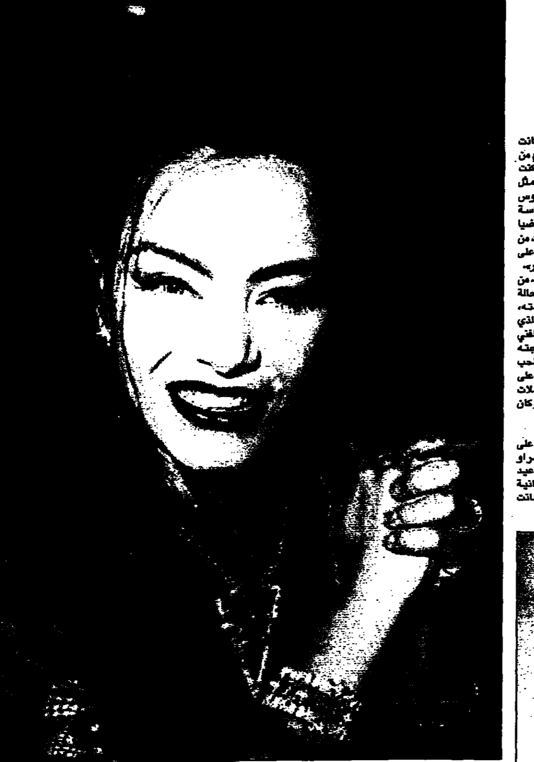
الفنانة شريهان والى اليمن في مشهد من فيلم صبيته مع هشام سليم